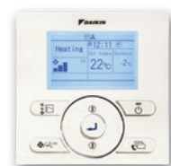
En option (BRC073)**